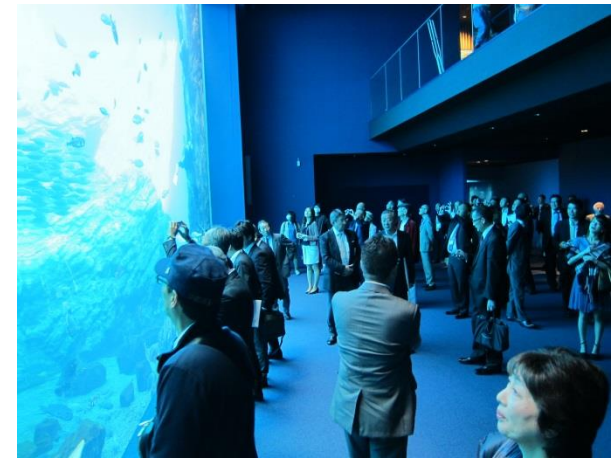
仙台うみの杜水族館 視察-2