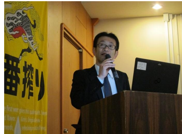
東北ブロック会議 記念講演