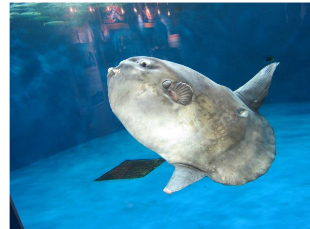
仙台うみの杜水族館 視察-3