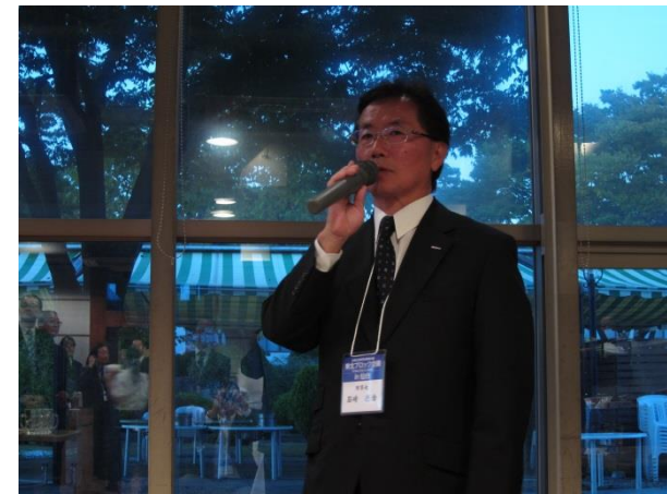
東北ブロック会議 懇親会