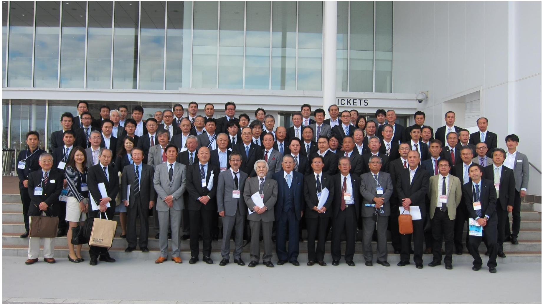
「仙台うみの杜水族館」前にて、参加者全員記念撮影