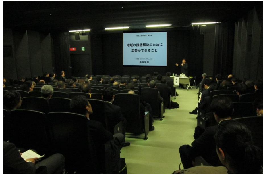
せんだいメディアテーク 7階 スタジオシアター