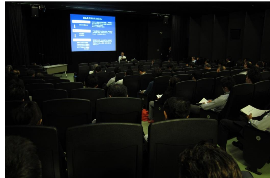
せんだいメディアテーク 7階 スタジオシアター