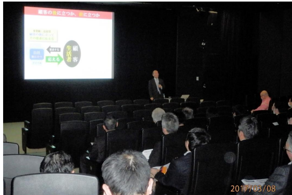
テーマ／～経験デザインと原型思考～