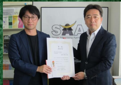
東北博報堂・武田氏 (左) と吉野広報メディア委員長 (右)