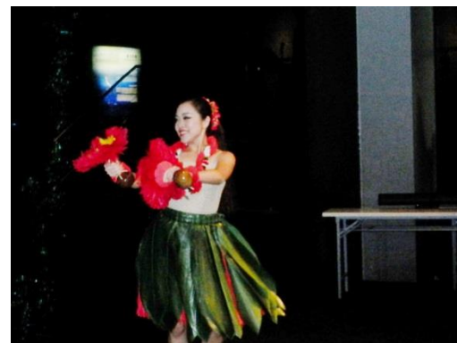
ハワイアンのフラダンス鑑賞