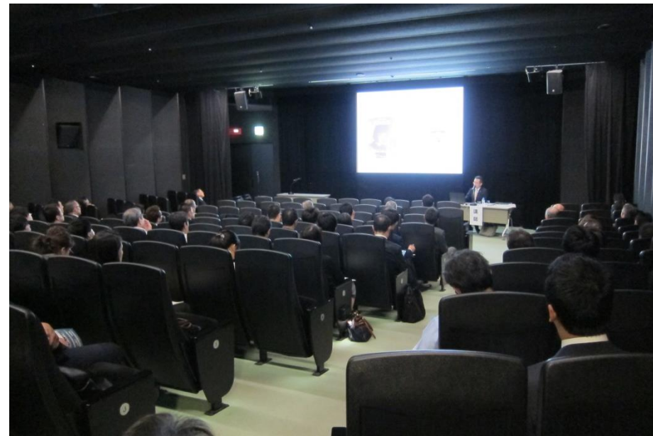
せんだいメディアテーク 7階 スタジオシアター