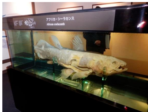
館内で見学「シーラカンス」の標本