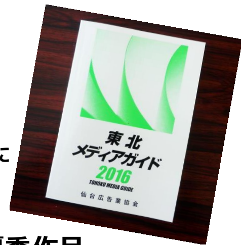
東北メディアガイド2016